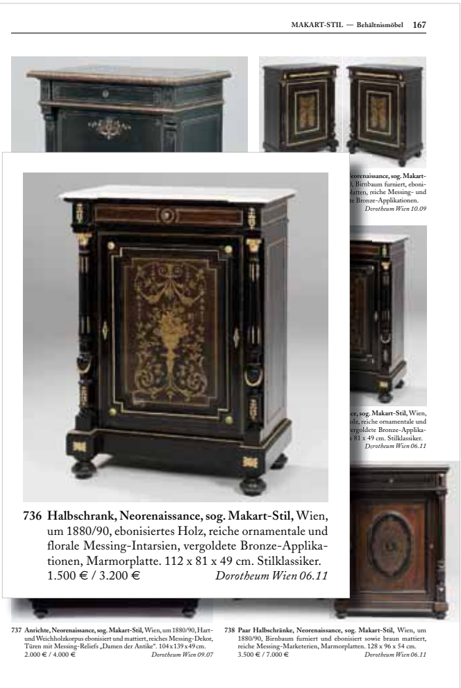
736 Halbschrank, Neorenaissance, sog. Makart-Stil, Wien, um 1880/90, ebonisiertes Holz, reiche ornamentale und florale Messing-Intarsien, vergoldete Bronze-Applikationen, Marmorplatte. 112 x 81 x 49 cm. Stilklassiker. 1.500 € / 3.200 € Dorotheum Wien 06.11

Dieser Artikel geht auf ein Gespräch mit Professor Rainer Haaff zurück. Er erscheint fast zeitgleich sowohl in dieser Zeitschrift als auch als Beitrag in dessen Buch "PRACHTVOLLE STILMÖBEL – Historismus in Deutschland und Mitteleuropa", veröffentlicht im Kunst-Verlag-Haaff. Die Fotos, die den Artikel im Buch illustrieren, sind hier allerdings nicht beigegeben – bis auf eins, es zeigt zum besseren Verständnis das Möbel, auf das ich mich in folgenden beziehe.